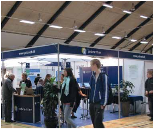
På messen Job & Uddannelse bemandede jobcenterne i Slagelse, Sorø, Faxe, Odsherred og Ringsted en fælles stand med titlen: - dit jobcenter.