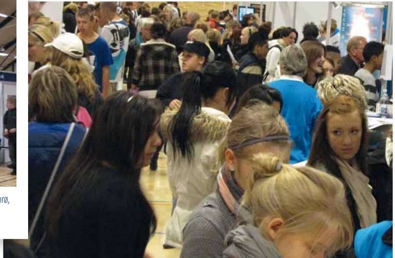
Job & Uddannelse havde 3200 besøgende på de to messedage.