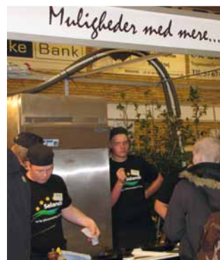
Der var gang i stegepanderne på Selandias store stand.