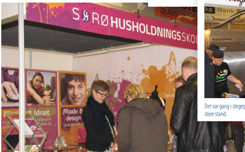
Sorø Husholdningsskole havde, udover bemanning af egen stand, inviteret 55 elever til at besøge messen om torsdagen.