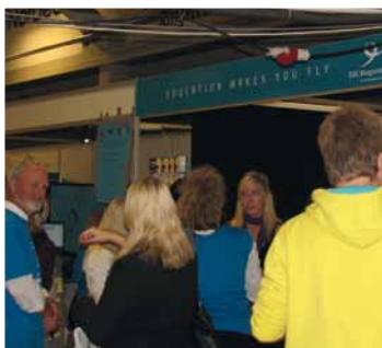
Stor interesse ved EUC Ringsteds stand.